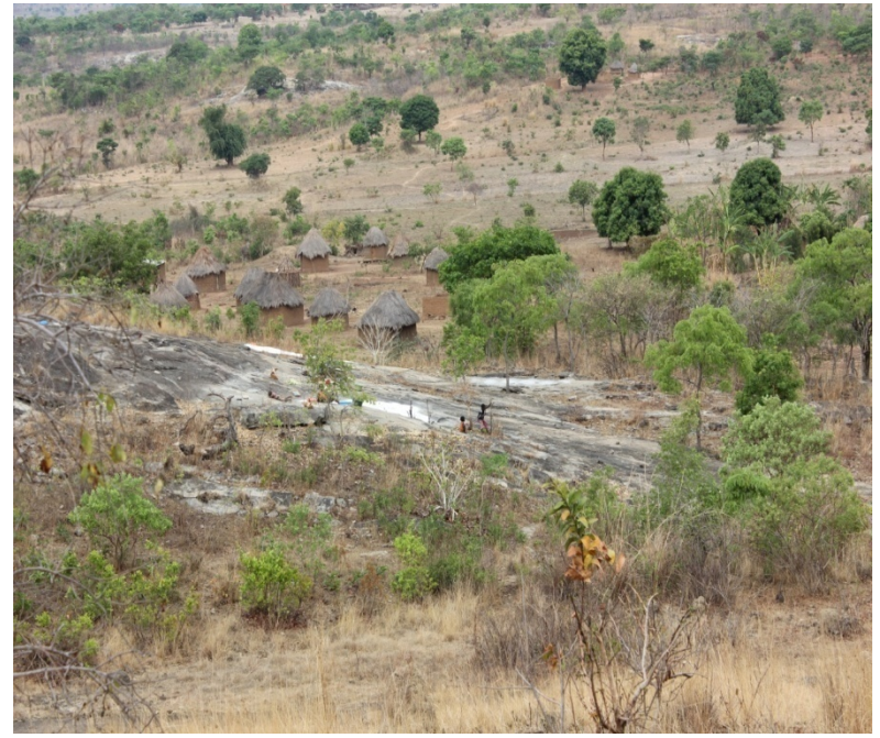
Imagem da parte frontal do Abrigo Sambú