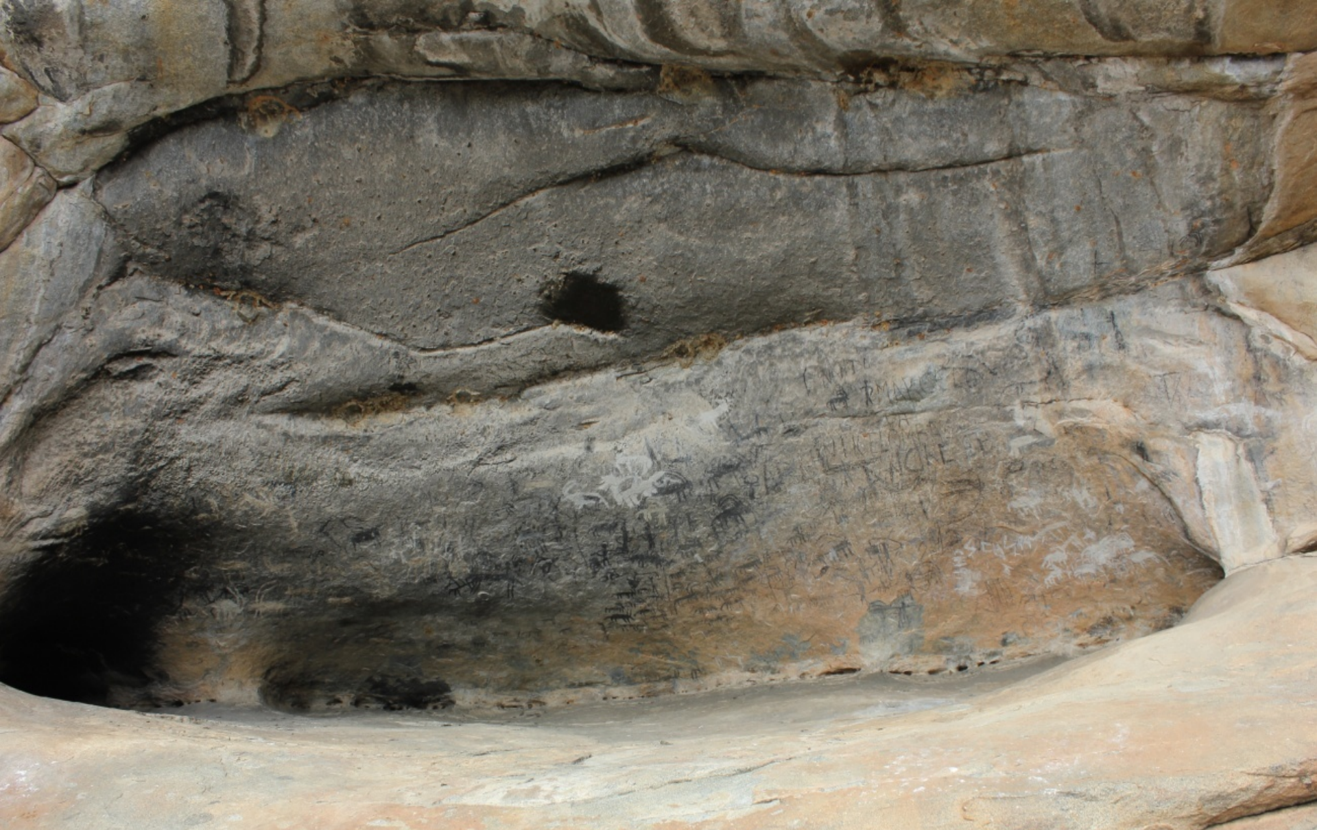
Abrigo do Sambú- Ganda , Província de Benguela