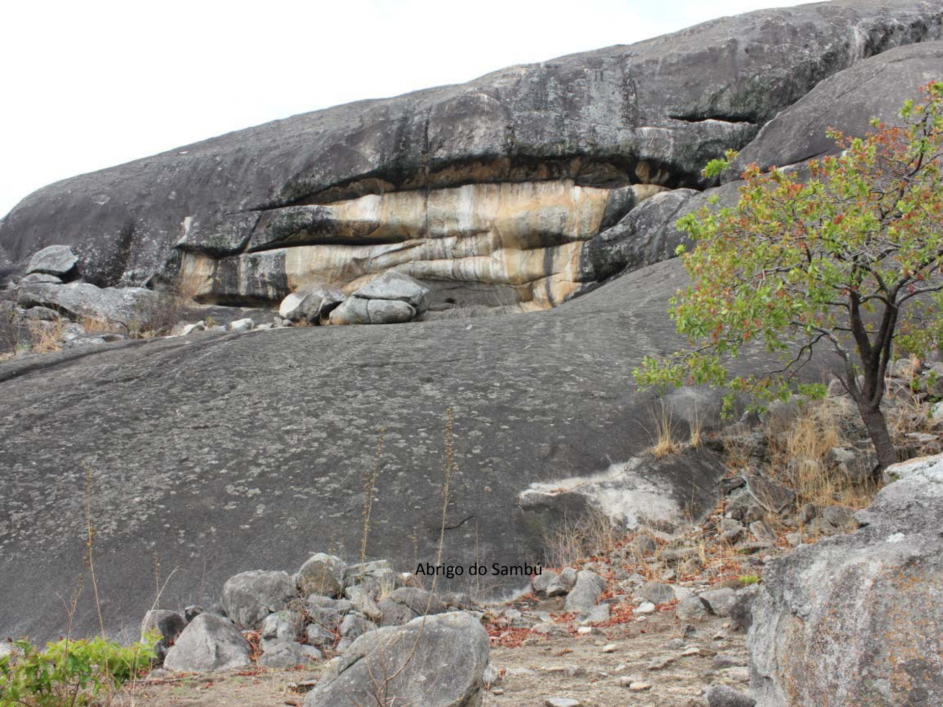
Abrigo do Sambú