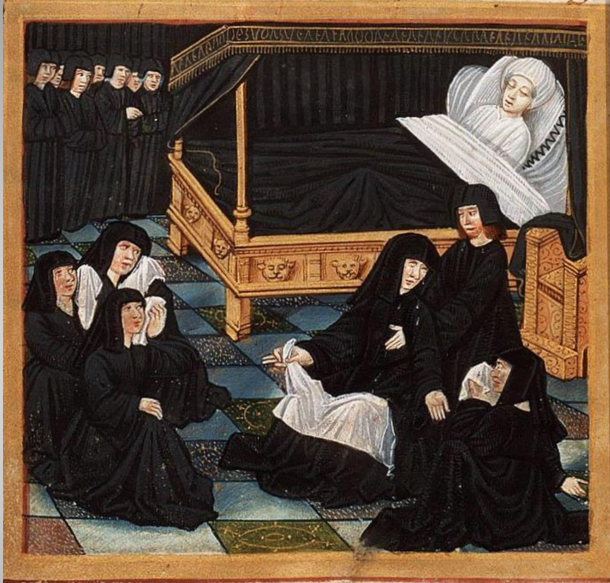
Leito de morte de Filipe de Commines (detalhe) Manuscrito francês do século XVI