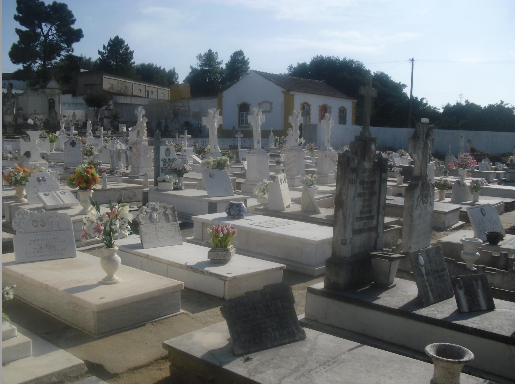
Ala lateral – sepulturas perpétuas