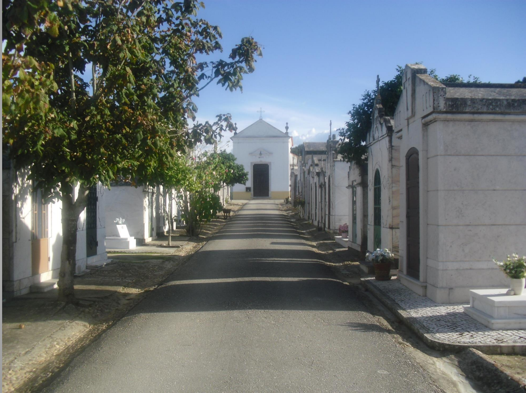
Cemitério da Chamusca – alameda principal