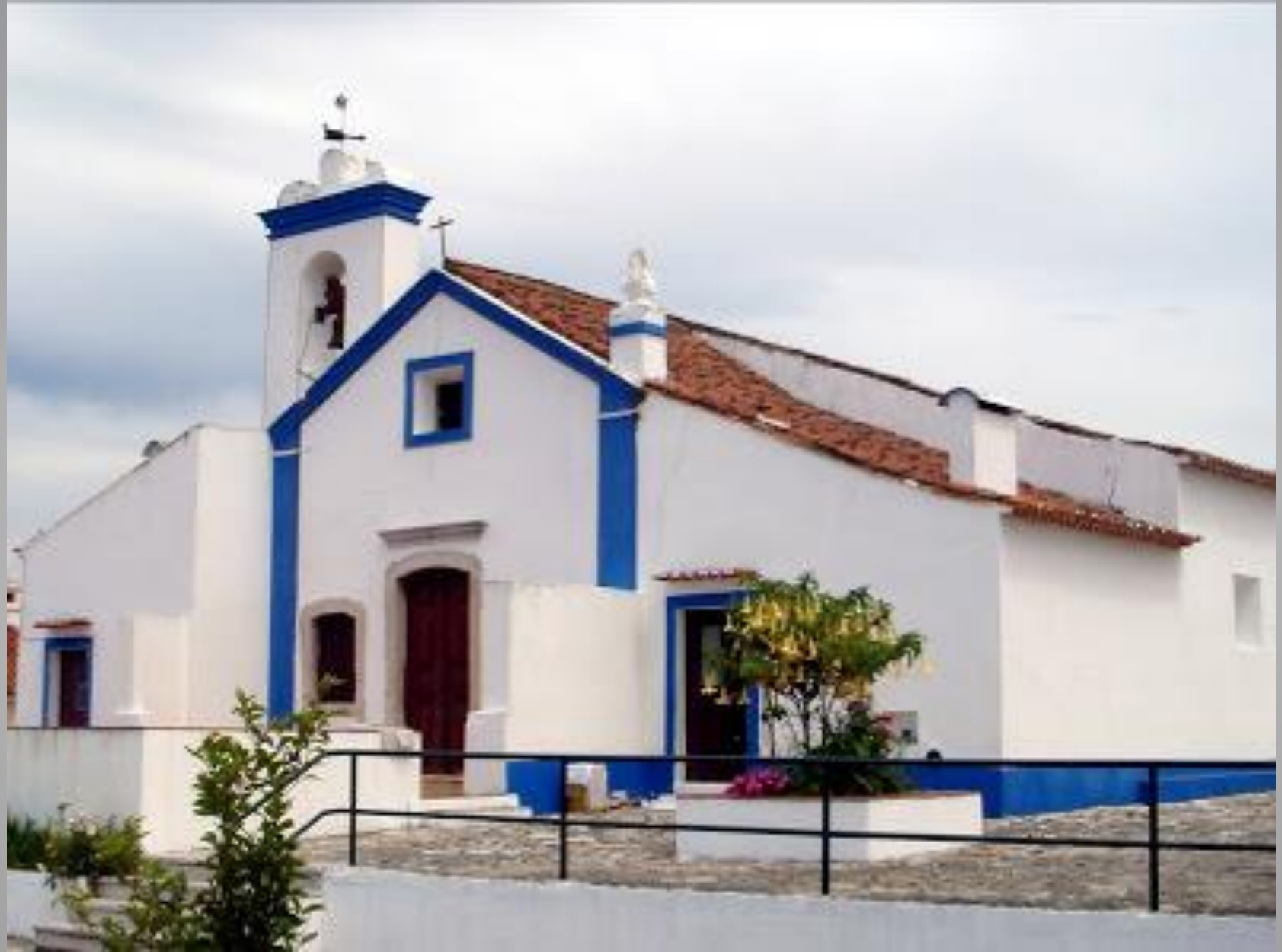
Chamusca – Capela de Nossa Senhora do Pranto