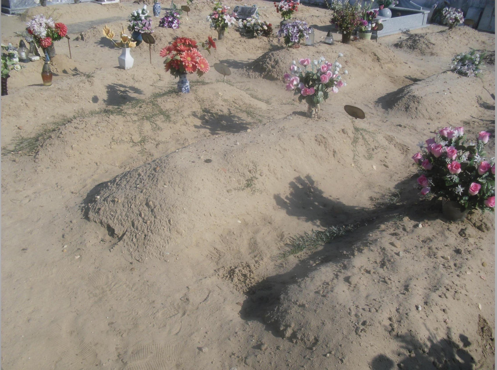
Zona posterior – covais comuns