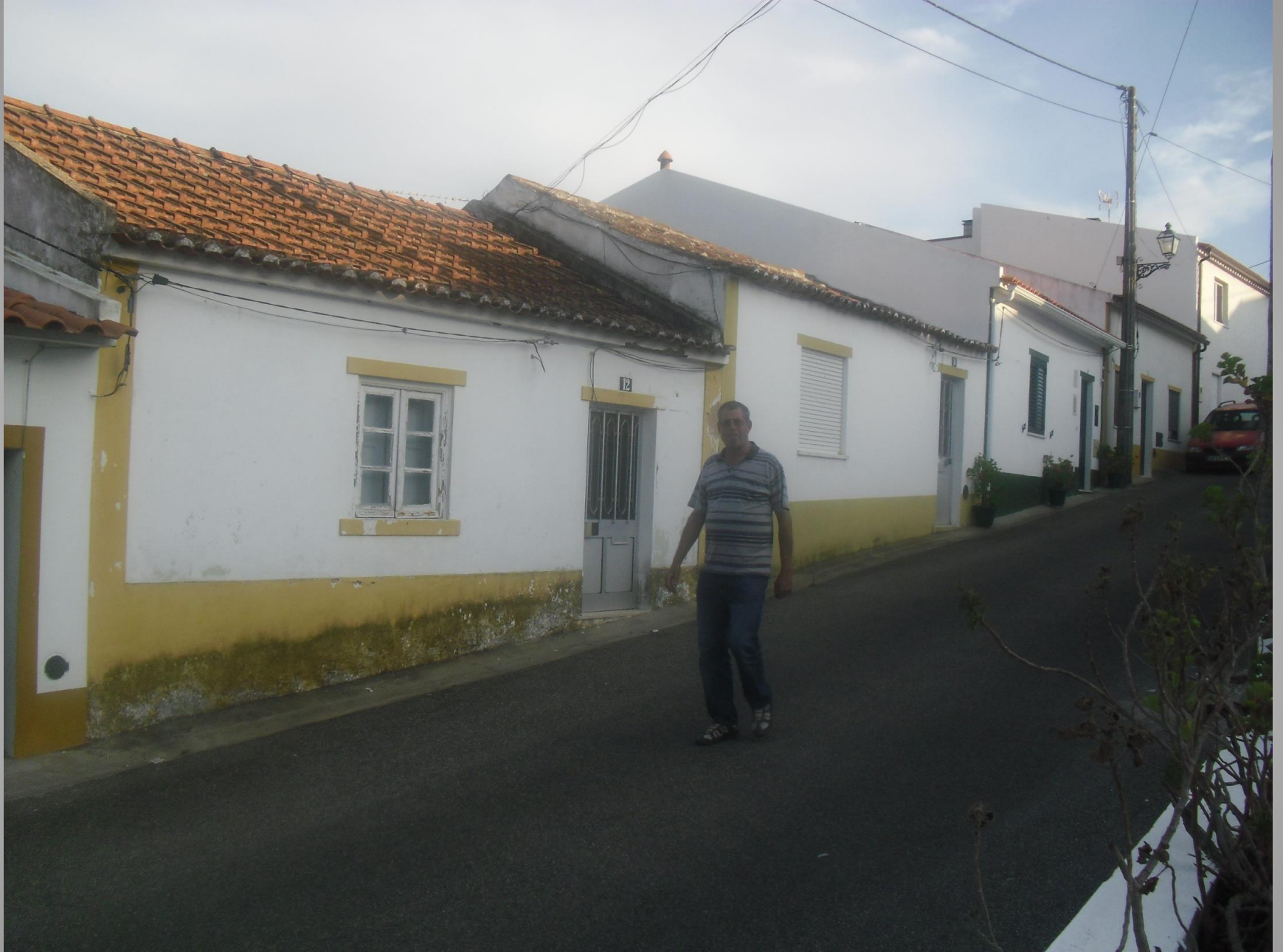
Chamusca – Outeiro do Pranto