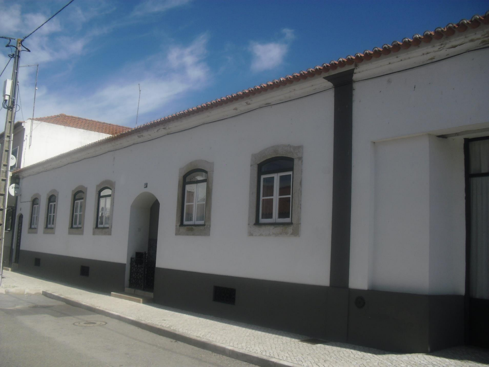
Chamusca – Rua lateral