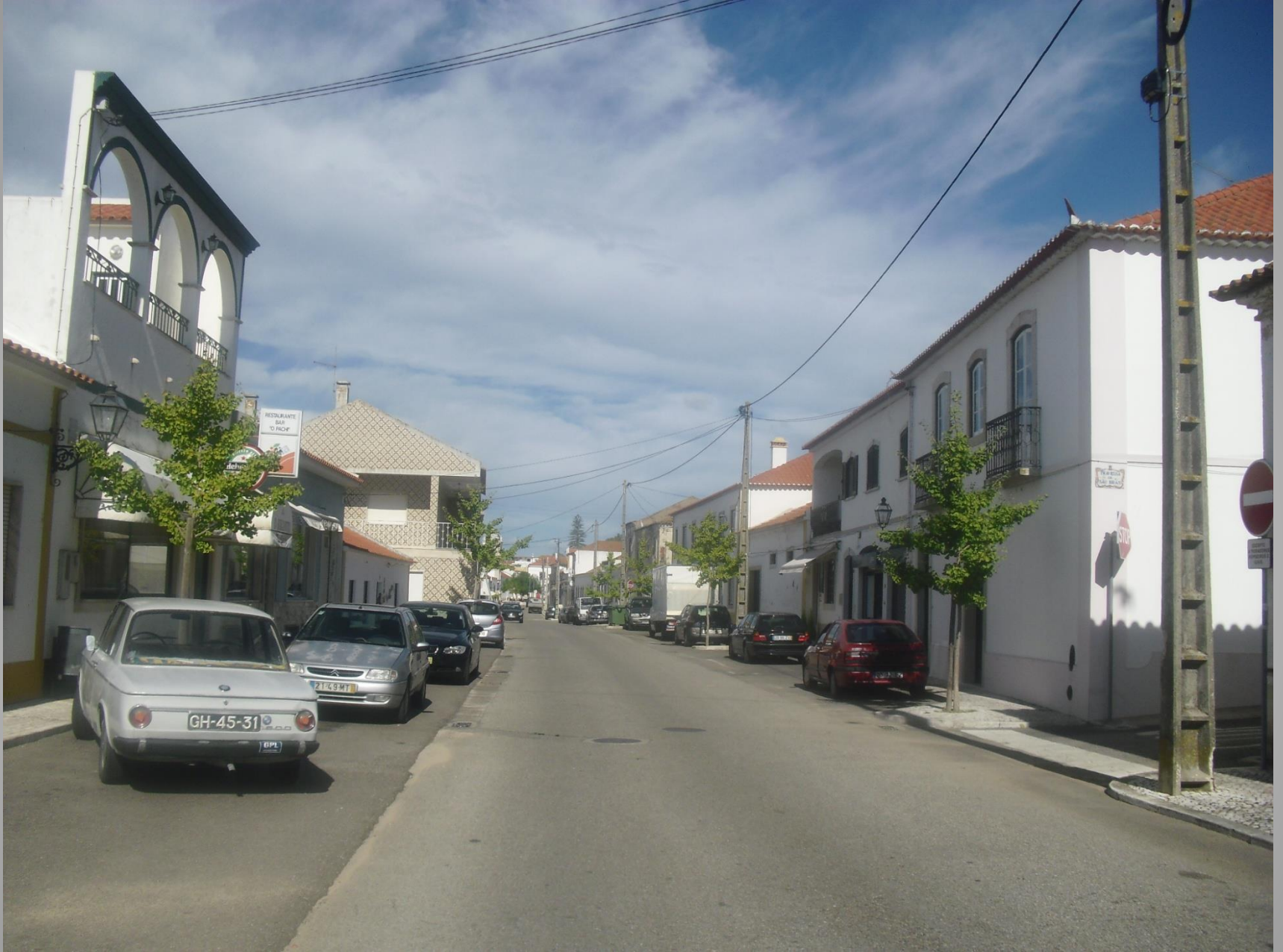
Chamusca – Rua lateral