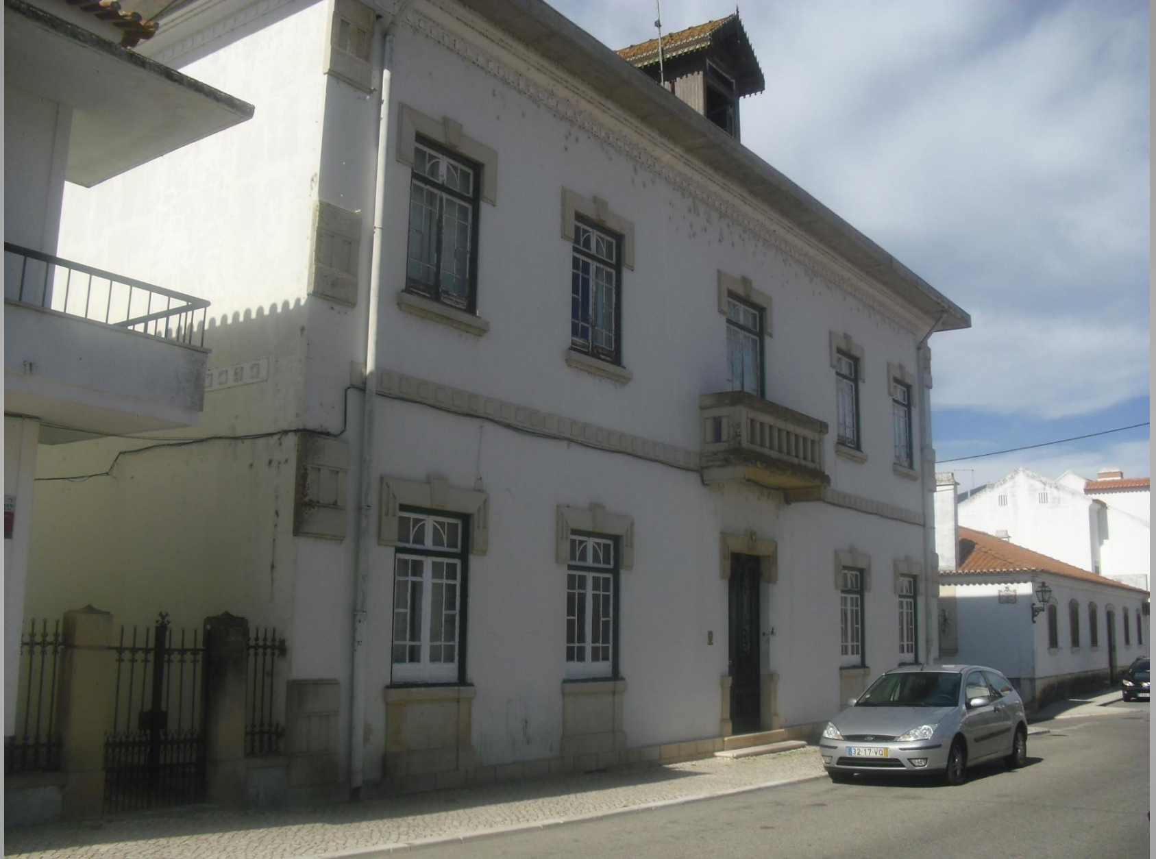
Chamusca – Rua lateral