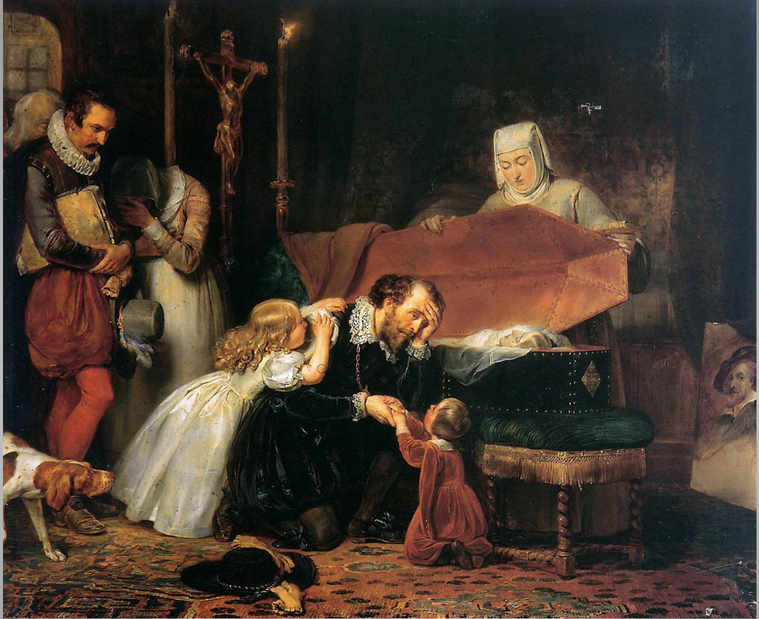
Rubens chorando a esposa Anthony van Dyck, 1. a metade séc. XVII