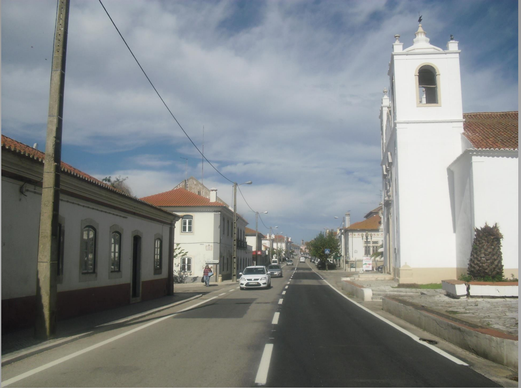
Chamusca – Rua Direita