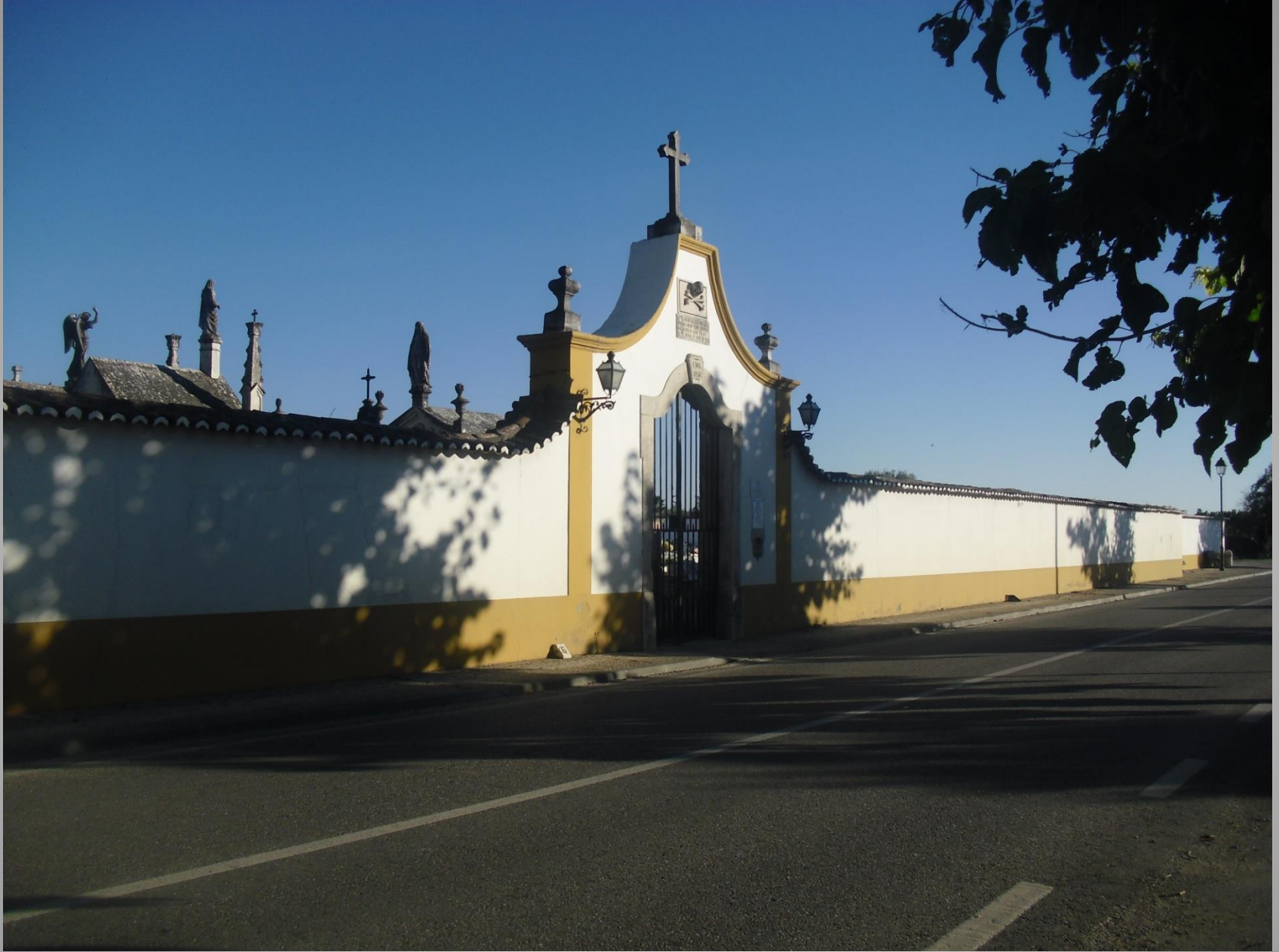
Cemitério da Golegã, 1856