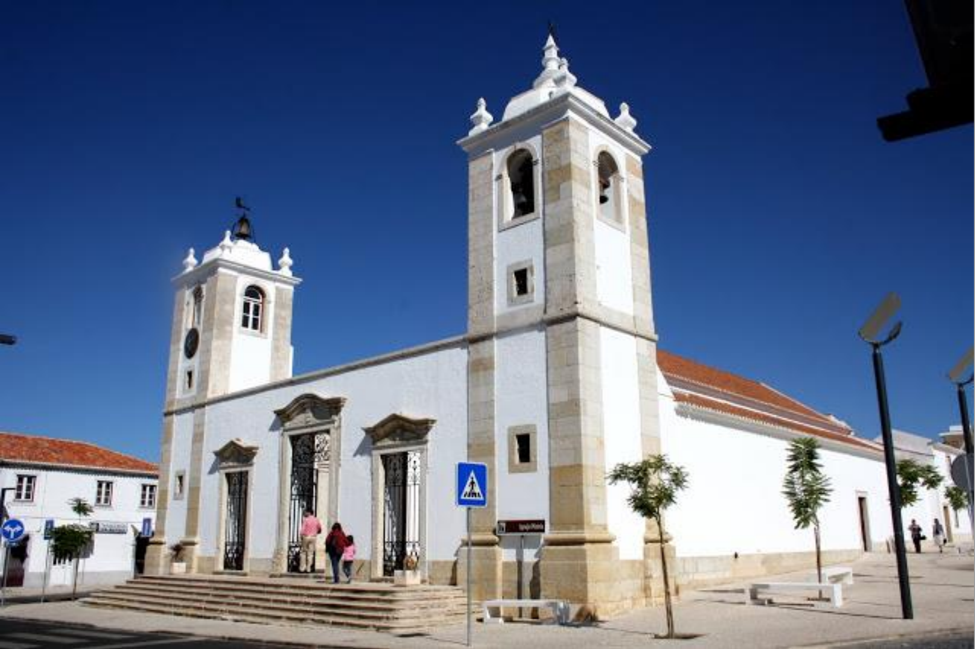
Chamusca – Igreja Matriz