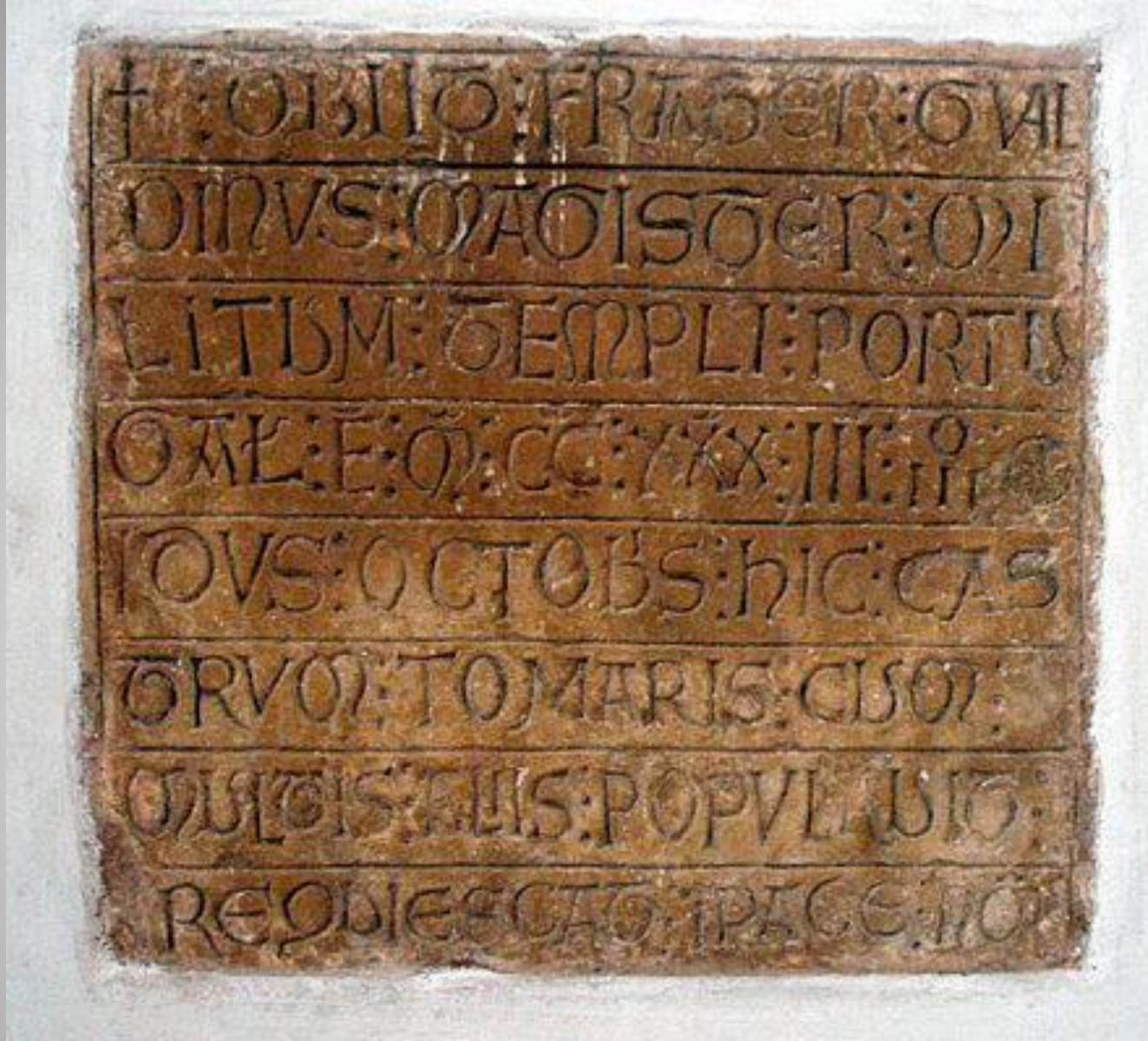
Lápide funerária de D. Gualdim Pais, séc. XII Igreja de Santa Maria do Olival - Tomar