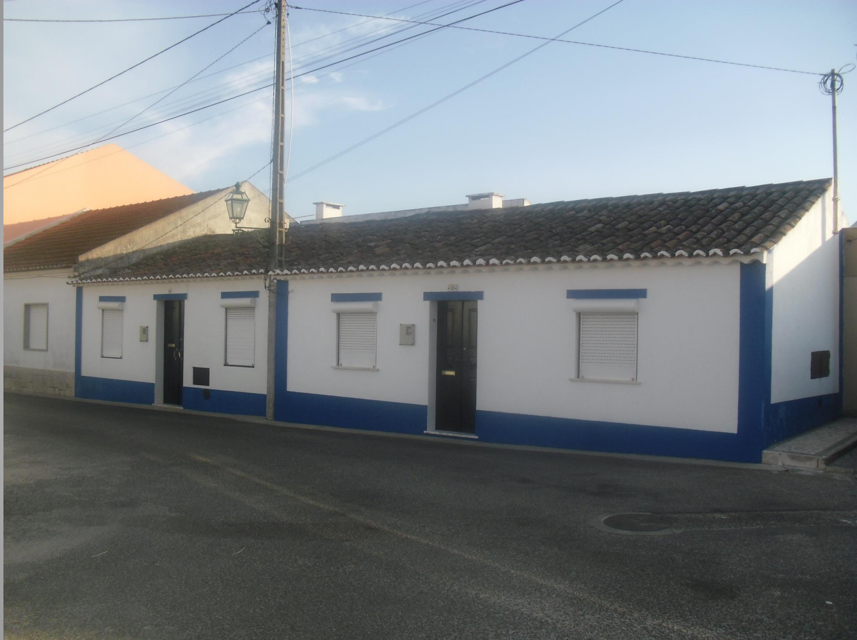
Chamusca – Outeiro do Pranto