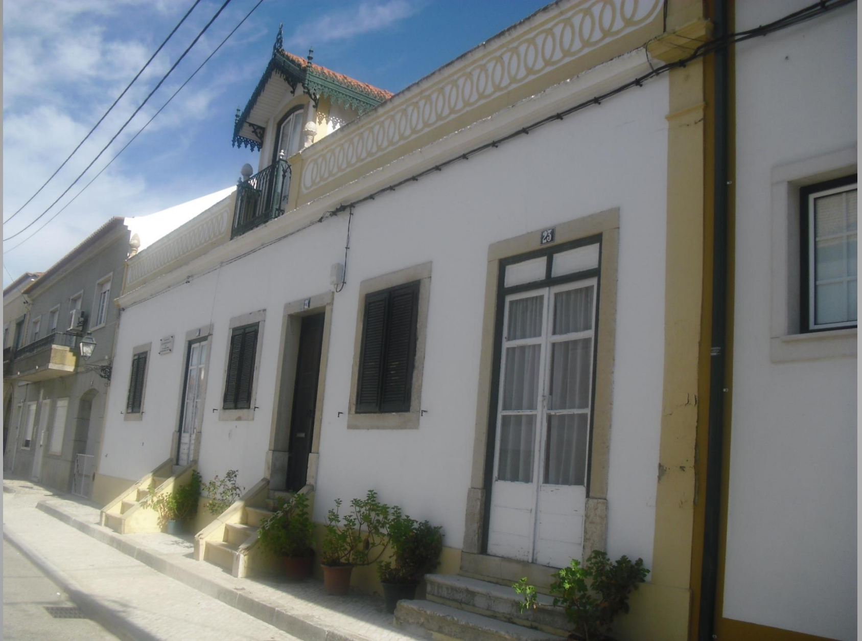
Chamusca – Rua lateral