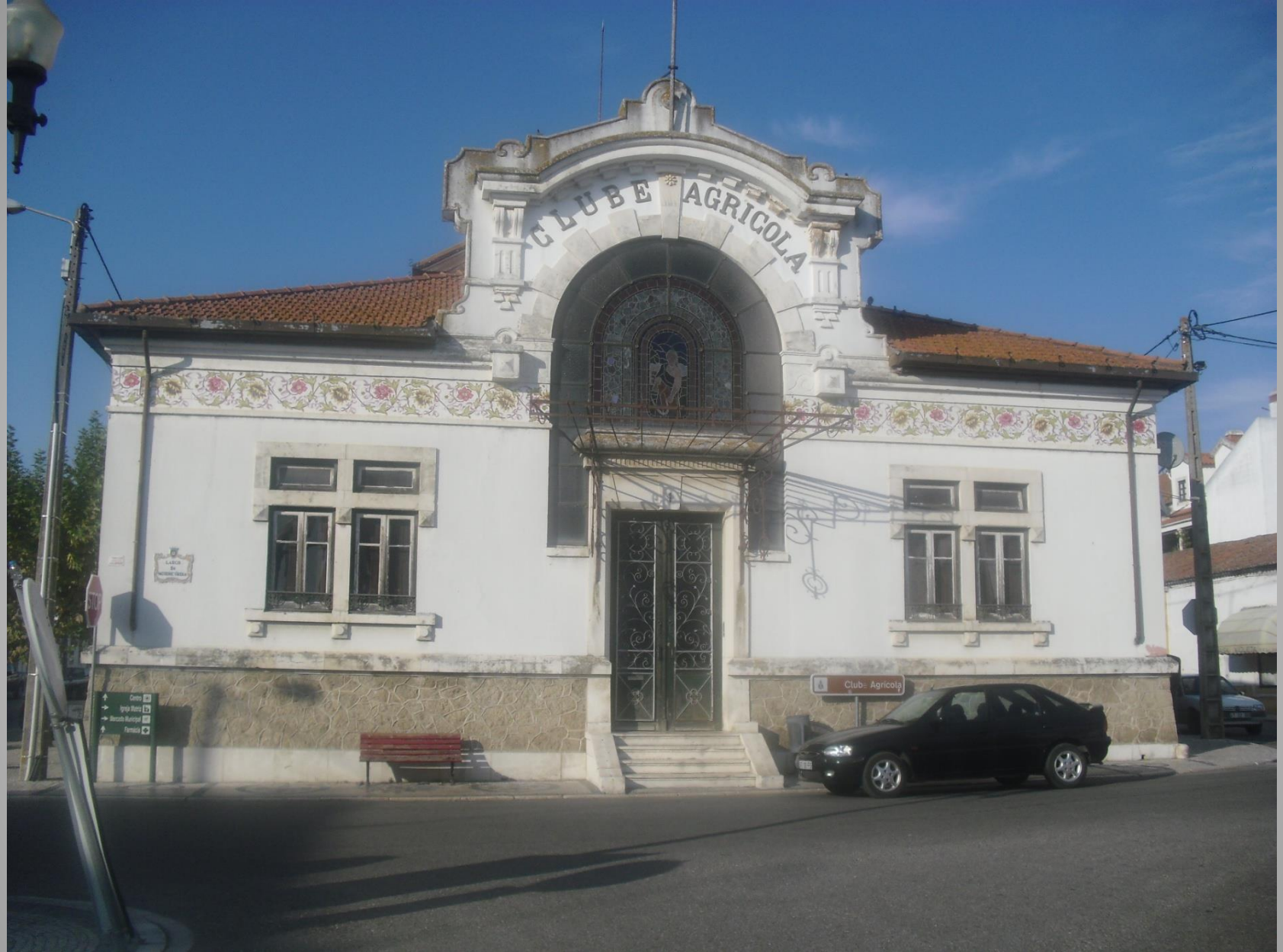
Chamusca – Clube Agrícola