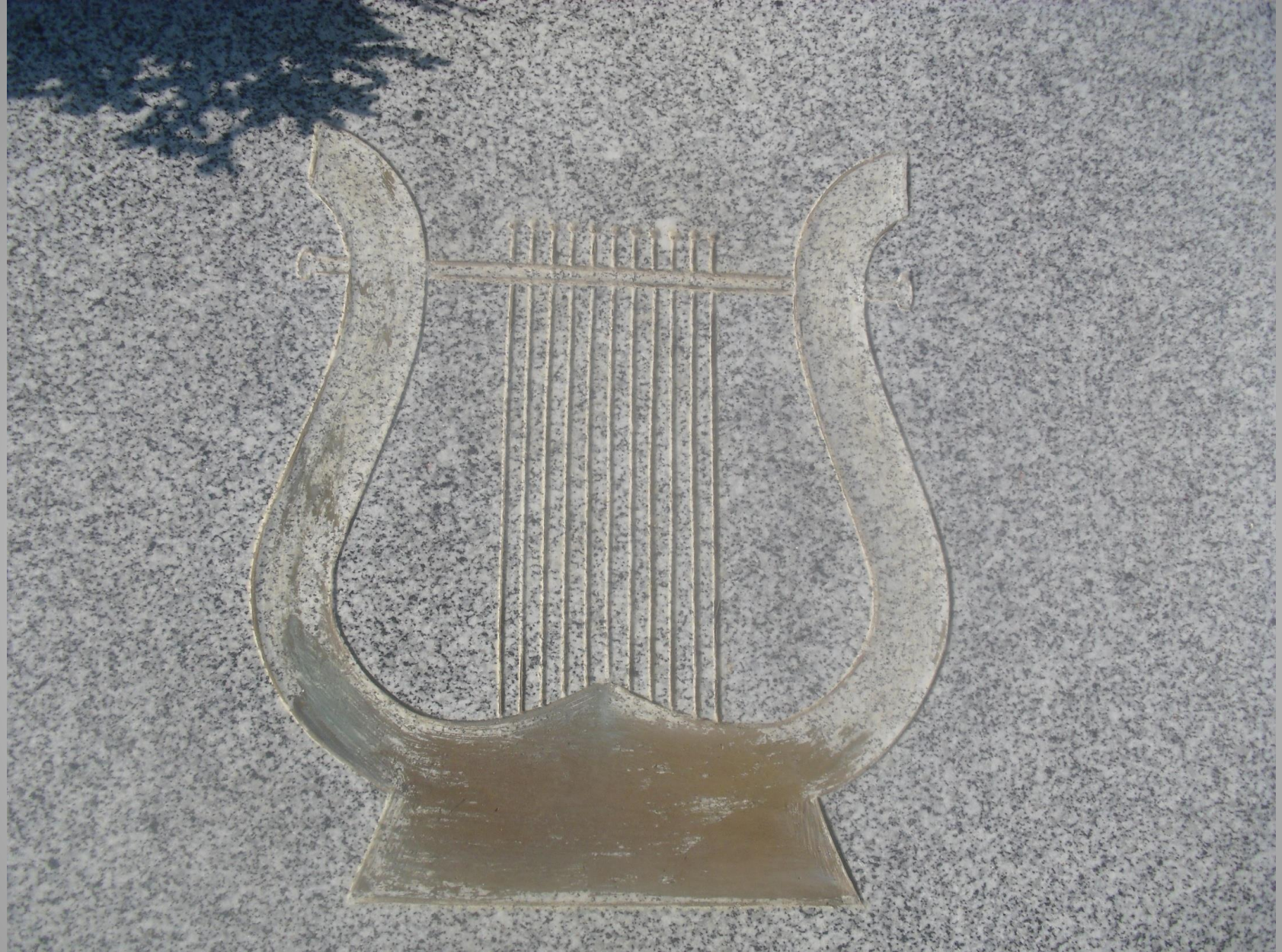
Músico – séc. XXI