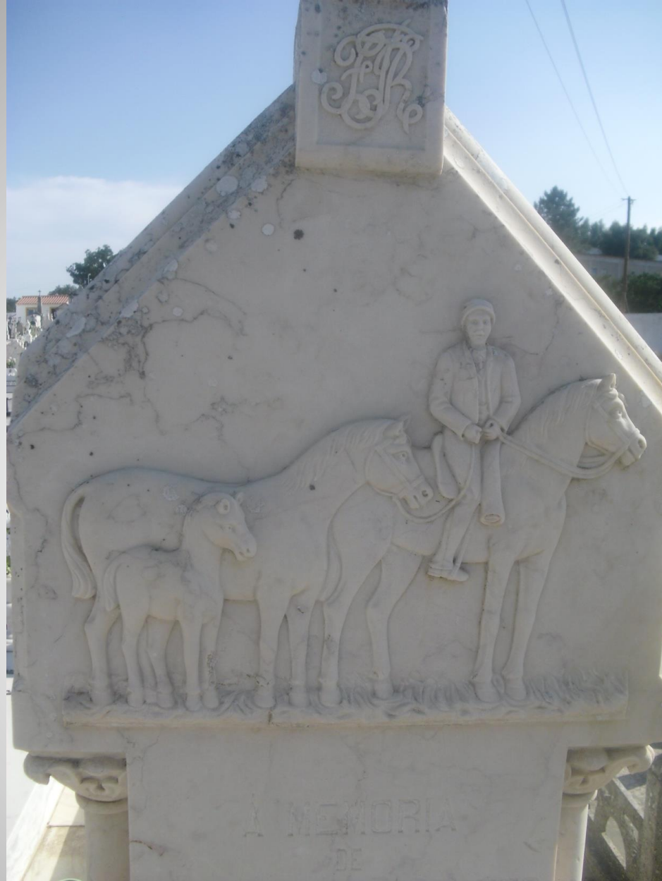
Comerciante de cavalos