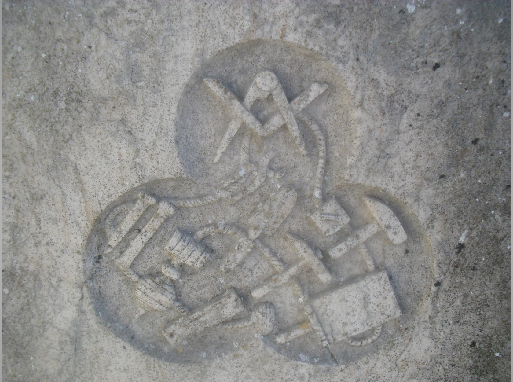
Pedreiro Pedreiro livre – maçon (?)